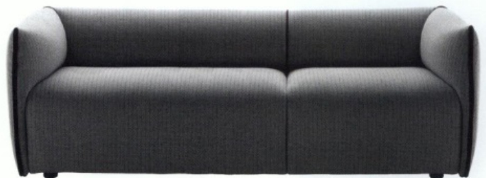
"MIA", design Francesco Bettoni. MDF