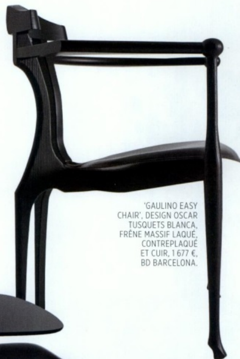
'GAULINO EASY CHAIR', DESIGN OSCAR TUSQUETS BLANCA, FRÈNE MASSIF LAQUÉ, CONTREPLAQUÉ ET CUIR, 1 677 €, BD BARCELONA.

Une unité de ton pour laisser parler les lignes et les textures : c'est le parti pris adopté dans la salle à manger de Marjolaine.