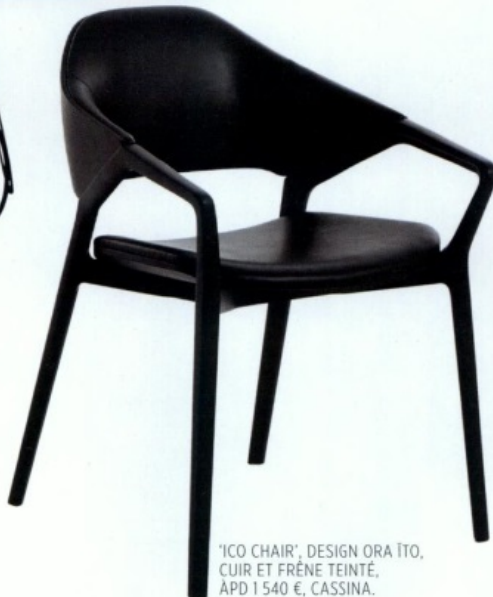
'ICO CHAIR', DESIGN ORA ITO, CUIR ET FRÈNE TEINTÉ, APD 1 540 €, CASSINA.