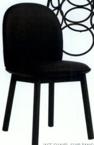
'ACE CHAIR', CUIR TANGO NOIR ET CHÊNE TEINTÉ, 740 €, NORMANN COPENHAGEN.