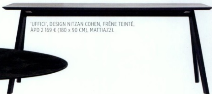
'UFFICI', DESIGN NITZAN COHEN, FRÈNE TEINTÉ, APD 2 169 € (180 x 90 CM), MATTIAZZI.