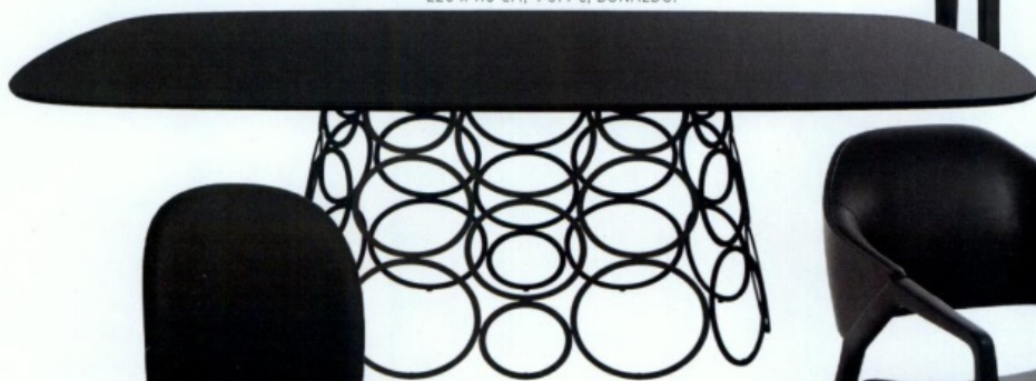
'HULAHOOB', PIED EN MÉTAL VERNI ET PLATEAU EN CHÊNE MASSIF TEINTÉ, 220 x 110 CM, 4 614 €, BONALDO.