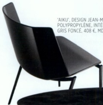
'AIKU', DESIGN JEAN-MARIE MASSAUD, POLYPROPYLENE, INTÉRIEUR DE COQUE GRIS FONCÉ, 408 €, MDF ITALIA.