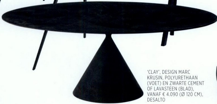
'CLAY', DESIGN MARC KRUSIN, POLYURETHAAN (VOET) EN ZWARTE CEMENT OF LAVASTEEN (BLAD), VANAF € 4.090 (Ø 120 CM), DESALTO