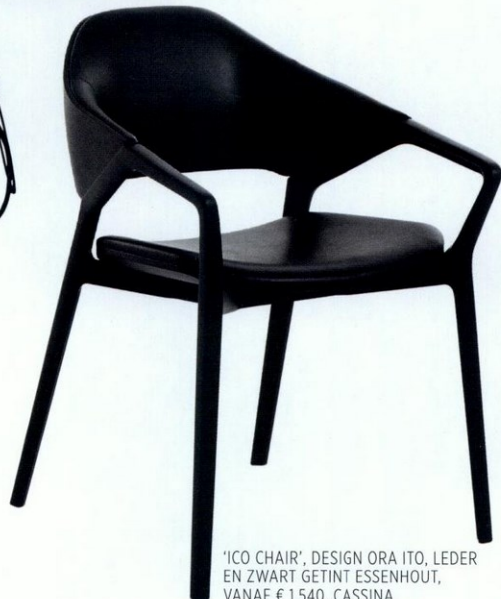
'ICO CHAIR', DESIGN ORA ITO, LEDER EN ZWART GETINT ESSENHOUT, VANAF € 1.540, CASSINA