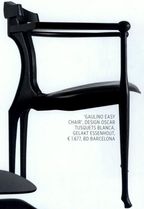
'GAULINO EASY CHAIR', DESIGN OSCAR TUSQUETS BLANCA, GELAKT ESSENHOUT, € 1.677, BD BARCELONA