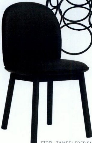
STOEL, ZWART LEDER EN GETINTE EIK, € 740, NORMANN COPENHAGEN