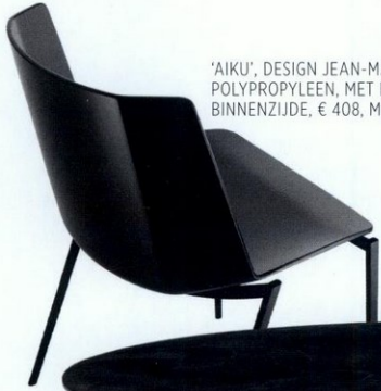
'AIKU', DESIGN JEAN-MARIE MASSAUD, POLYPROPYLEEN, MET DONKERGRUIZE BINNENZIJD, € 408, MDF ITALIA