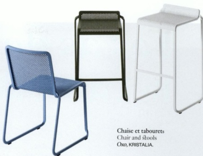
Chaise et tabourets Chair and stools Oxo, KRISTALIA.