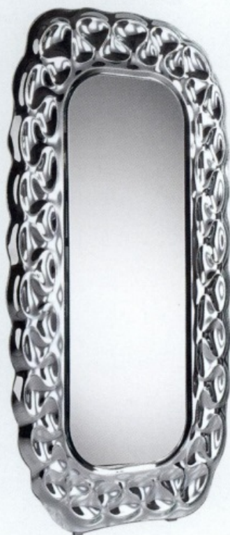
Miroir | Mirror Caldeira, FIAM ITALIA.