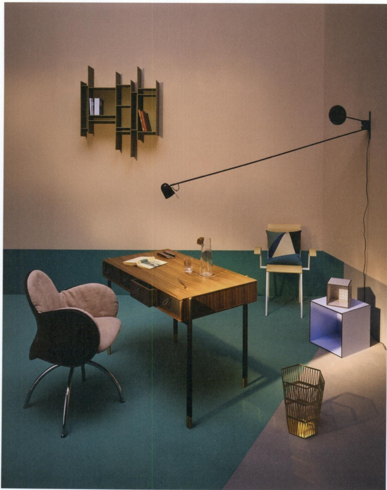
Poltroncina Incisa in cuoio con interno in tessuto sfoderabile e base in acciaio cromato, di Vico Magistretti per De Padova. Scrivitoio Eley in noce canaletta e metallo, design G. & O. Buratti per Porada. Contenitore Ellipse in metallo, design Abi Alice, e tagliacarte Pes in acciaio Golden Pink, design Giulio Iacchetti, tutto Alessi. Caraffa e bicchiere Parrot in cristallo, design Tomas Kral per Nude. Libreria Randomito in legno laccato, design Neuland Industriedesign per MDF Italia. Sedia Relog Chair in metallo verniciato e legno di quercia, Nobody&Co. Cuscino Reverie in tessuto di Maison Popineau. Lampada Counterbalance in acciaio, design Daniel Rybakken per Luceplan. Cubi di pannelli laminati, Abet Laminati. Gettacarte Tip Top in acciaio traforato finitura oro, di Richard Hutten, Ghidini 1961