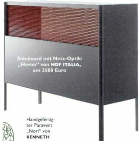
Sideboard mit Netz-Optik: „Heron“ von MDF ITALIA , um 3500 Euro

Die hohe Kunst der Geometrie: Mal belebt ein grafisches GITTERMUSTER eintönige Flächen. Ein andermal durchbricht ein luftiges MASCHENNETZ eine streng minimalistische Form und gewährt so reizvolle DURCHBLICKE .