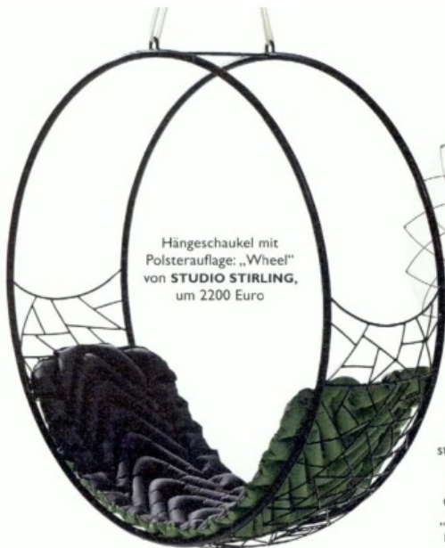
Hängeschaukel mit Polsterauflage: „Wheel“ von STUDIO STIRLING , um 2200 Euro