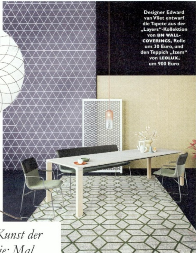
Designer Edward van Vliet entwarf die Tapete aus der „Layers“-Kollektion von BN WALLCOVERINGS , Rolle um 30 Euro, und den Teppich „Izem“ von LEOLUX , um 900 Euro