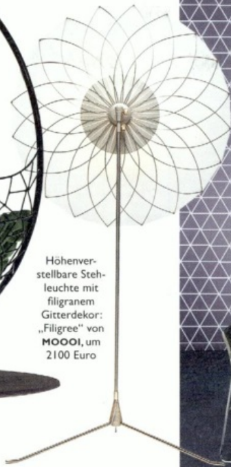
Höhenverstellbare Stehleuchte mit filigranem Gitterdekor: „Filigree“ von MOOOI , um 2100 Euro