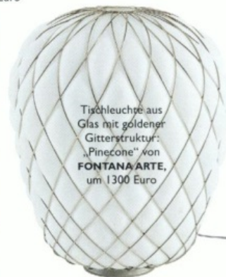
Tischleuchte aus Glas mit goldener Gitterstruktur: „Pinecone“ von FONTANA ARTE , um 1300 Euro