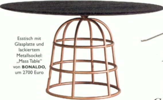
Esstisch mit Glasplatte und lackiertem Metallsockel: „Mass Table“ von BONALDO , um 2700 Euro