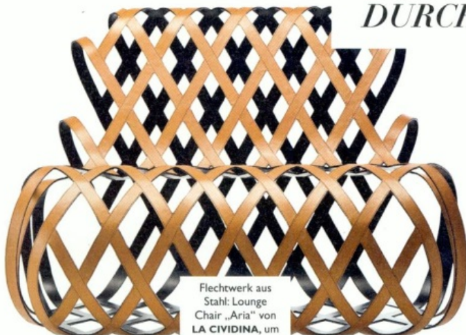
Flechtwerk aus Stahl: Lounge Chair „Aria“ von LA CIVIDINA , um 8100 Euro