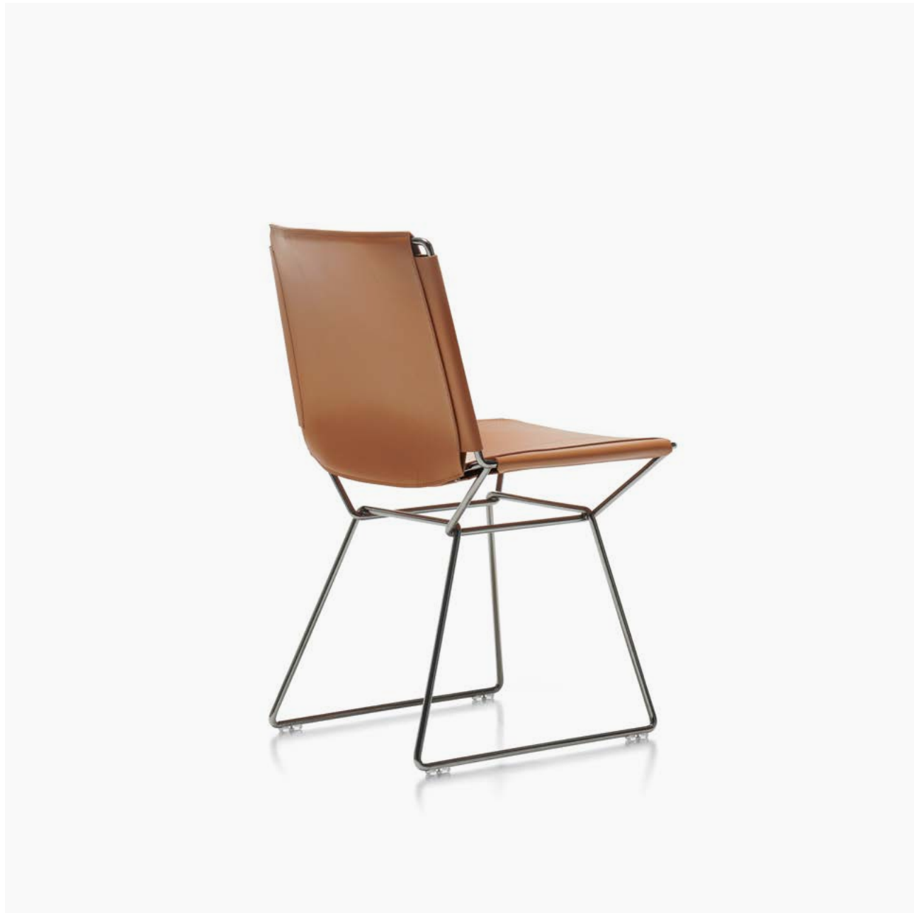
Scocca in cuoio colore naturale e base cromo nero. Shell in natural saddle-hide and black chrome base.