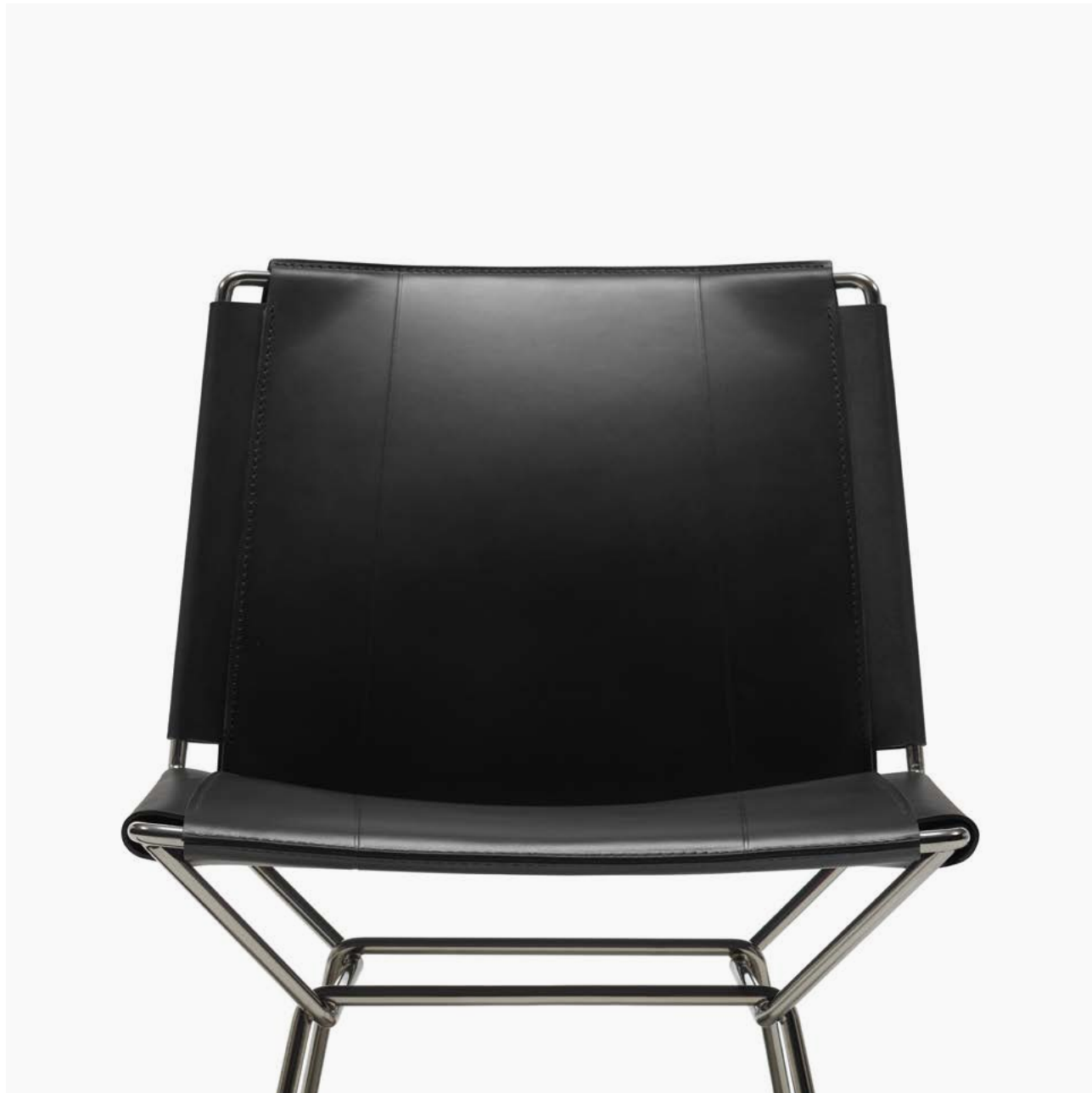
Scocca in cuoio colore nero e base cromo nero. Shell in black saddle-hide and black chrome base.