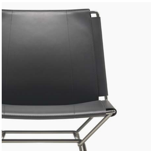
03 Grigio scuro / Dark grey