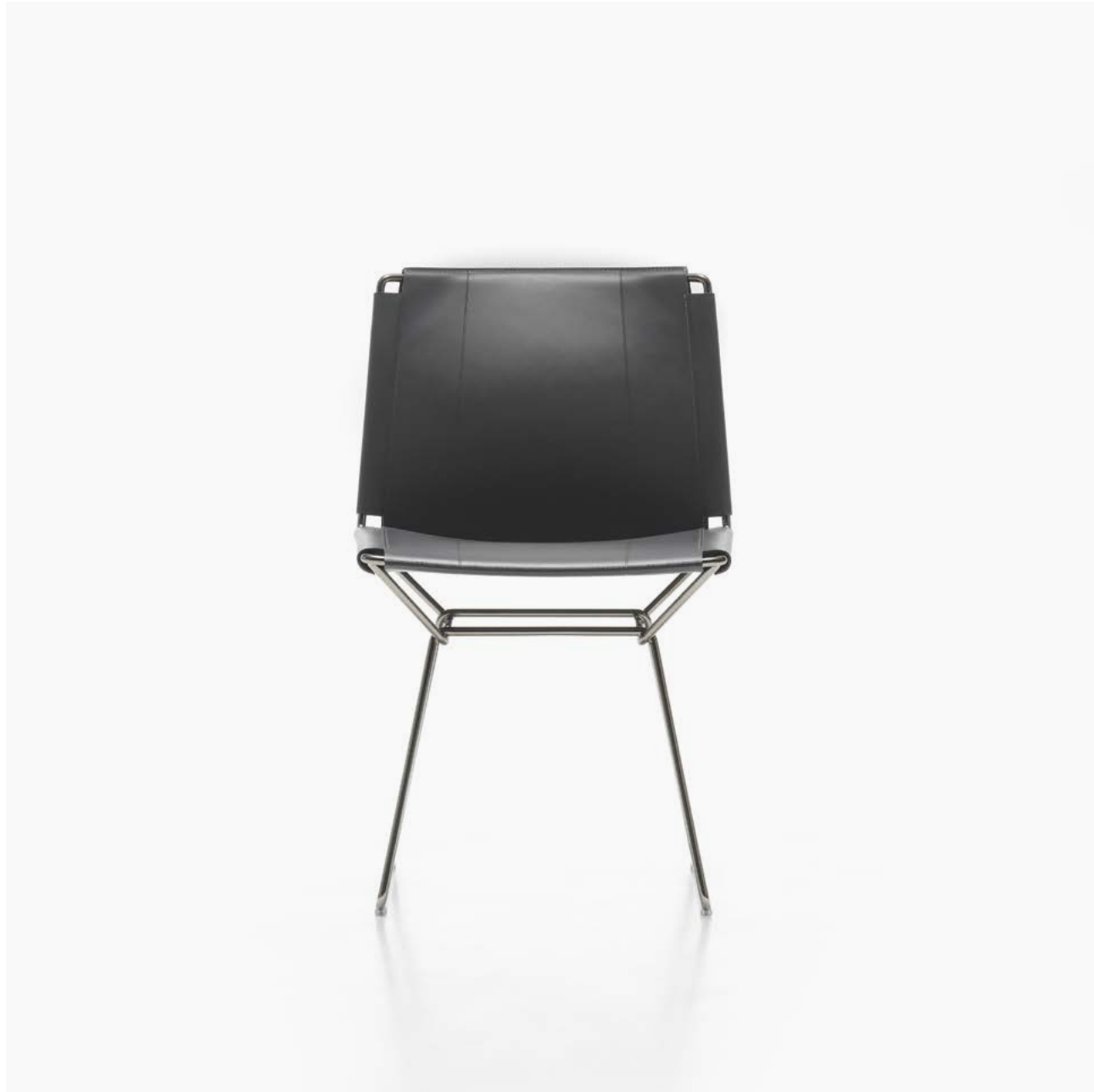
Scocca in cuoio colore grigio scuro e base cromo nero. Shell in dark grey saddle-hide and black chrome base.