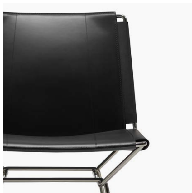
02 Nero / Black