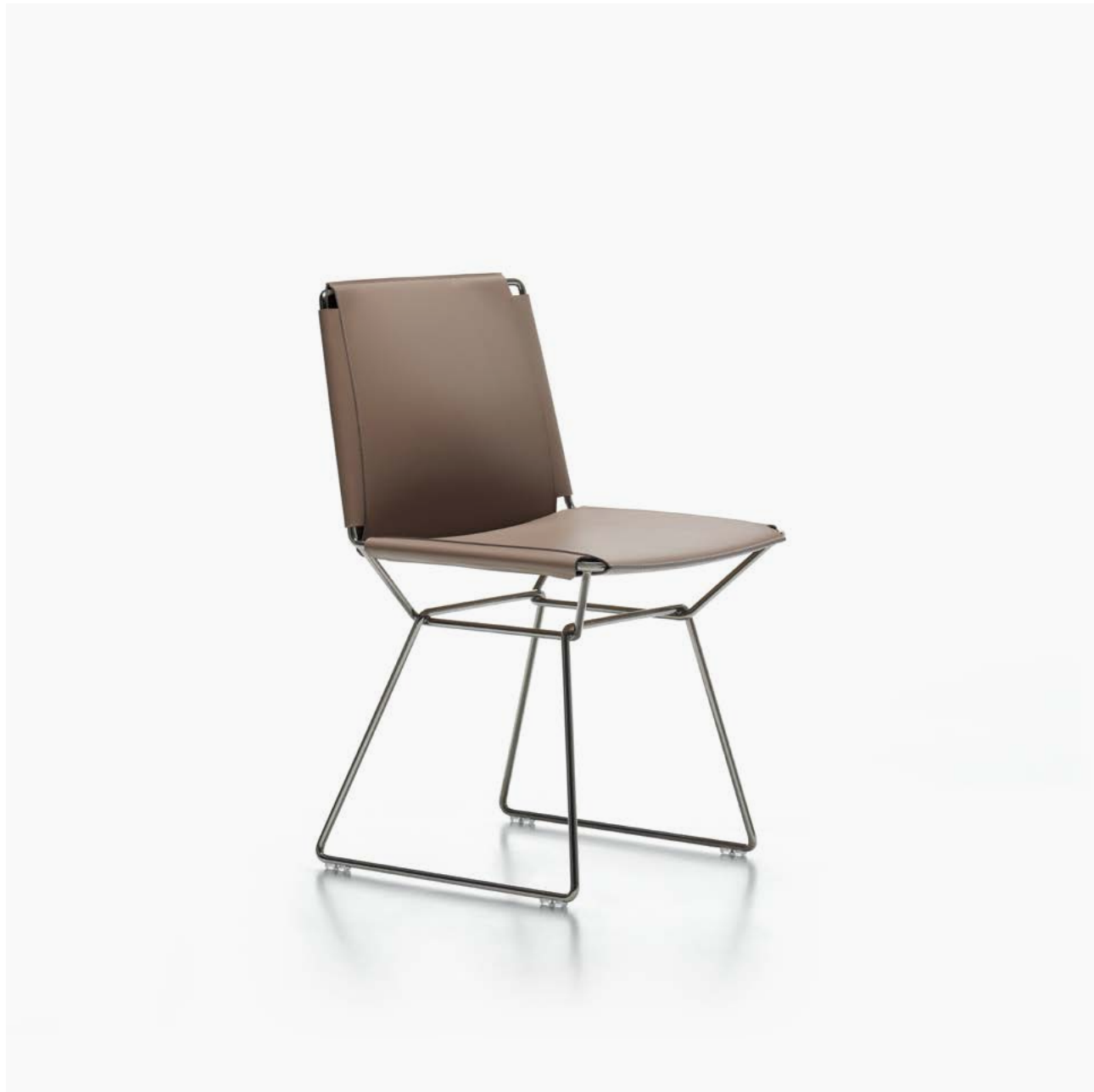
Scocca in cuoio colore tortora e base cromo nero. Shell in turtledove saddle-hide and black chrome base.