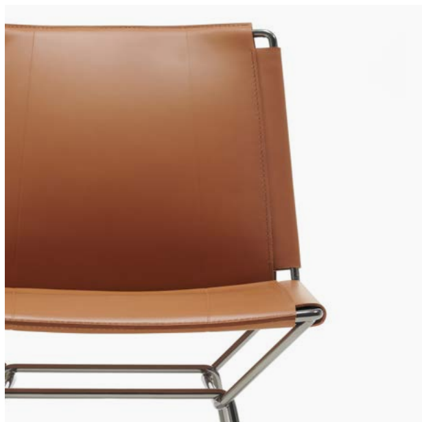
26 Naturale / Natural