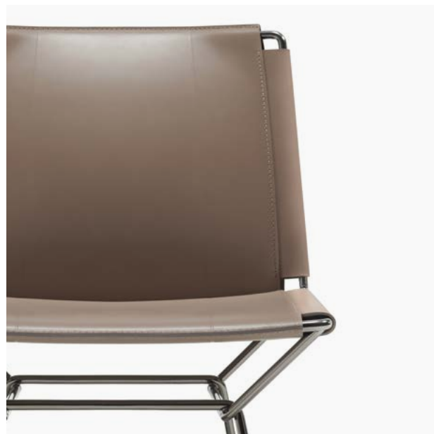
29 Tortora / Turtledove