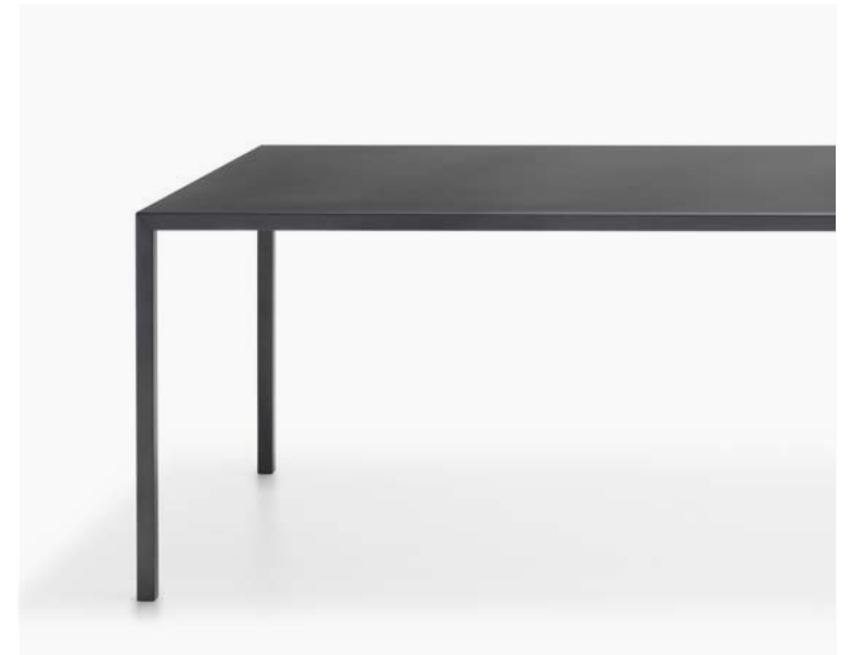
Tavolo dalla finitura monomaterica, completamente rivestito in lamiera di alluminio. / A table with a mono-material finish, entirely covered in aluminium sheet.