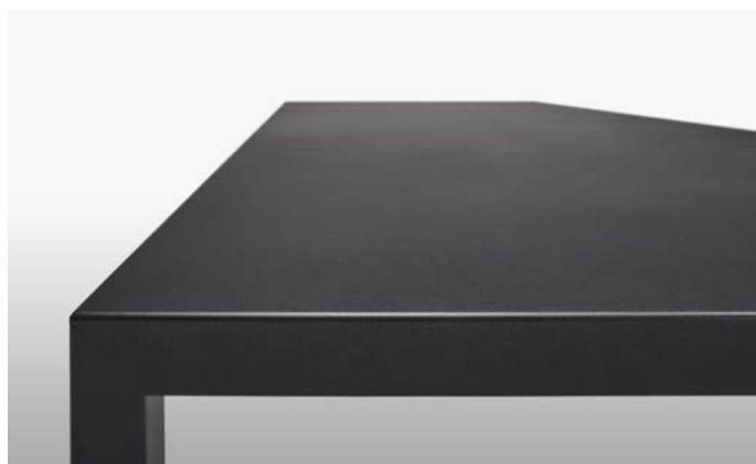
verniciato gofrato nero ferro (effetto nuvolato) goffered iron black painted (cloudy shaded effect)