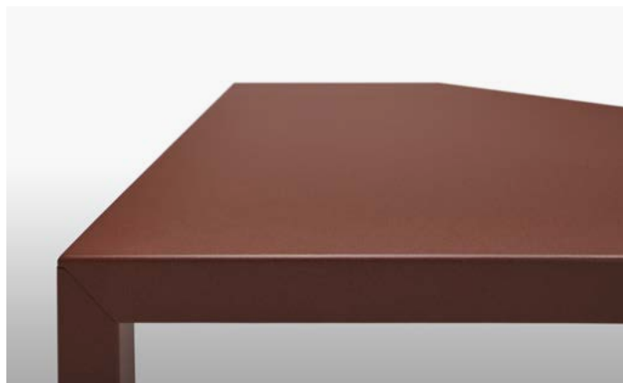
verniciato gofrato corten goffered corten painted