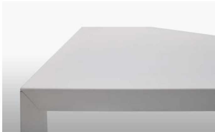
verniciato gofrato bianco goffered white painted