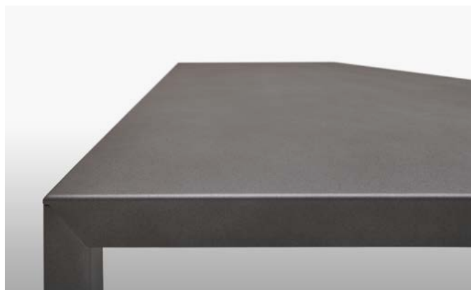
verniciato gofrato peltro (effetto nuvolato) goffered pewter painted (cloudy shaded effect)