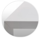
Verniciato gofrato opaco bianco X124