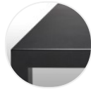
Verniciato gofrato opaco nero ferro X130