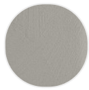
Pietra ricostruita bianco calce X131