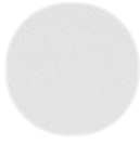
Verniciato opaco bianco X053