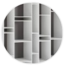
Laccato opaco bianco X042